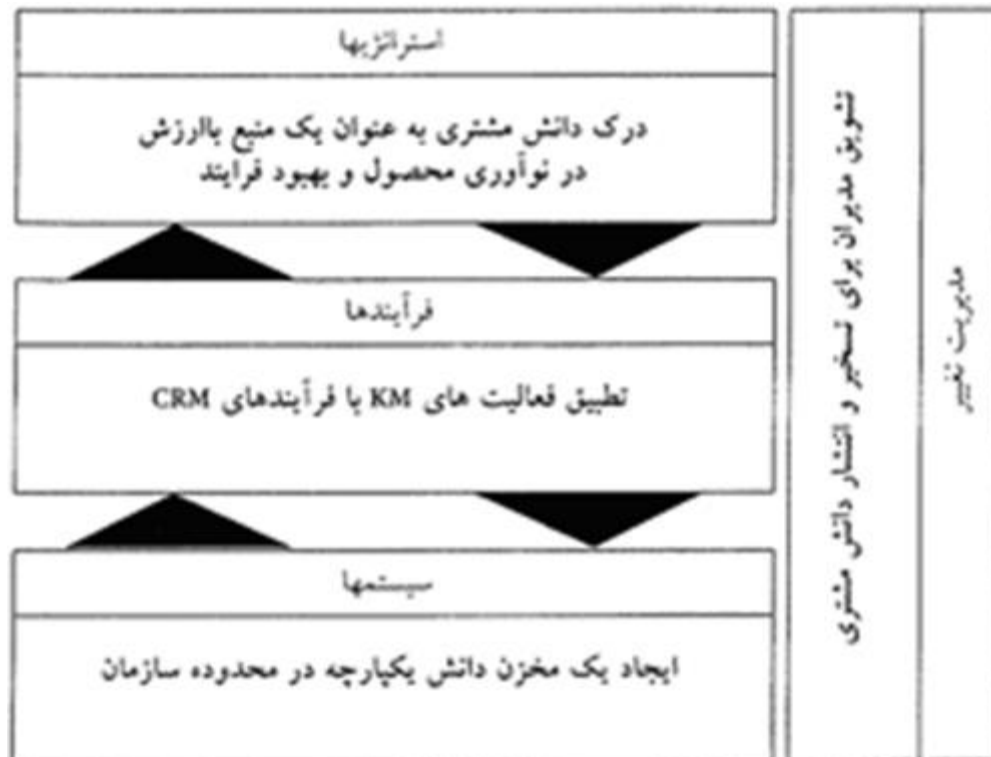
شکل ۲- چارچوب پیشنهادی برای پیاده سازی CRM مبتنی بر دانش