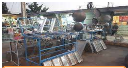
نمونه از بازار صنایع دستی کردند