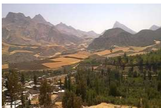
ارتفاعات قلعه قاضی