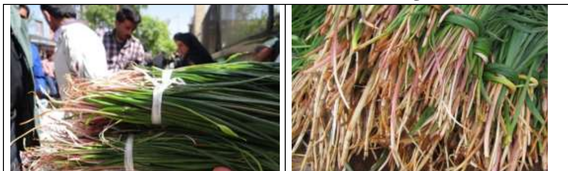
گیاه دارویی سیرونه (بته سرخ)