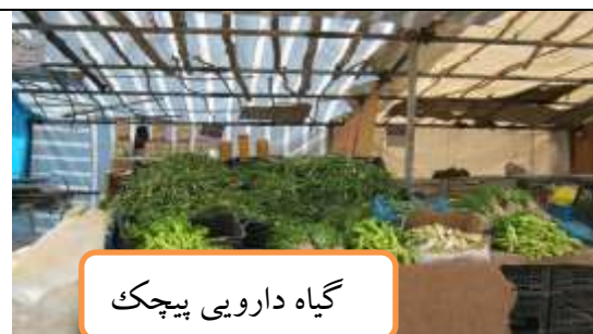
گیاه دارویی پیچک