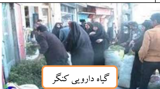
گیاه دارویی کنگر