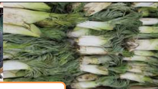
گیاه دارویی زو و بازار آن