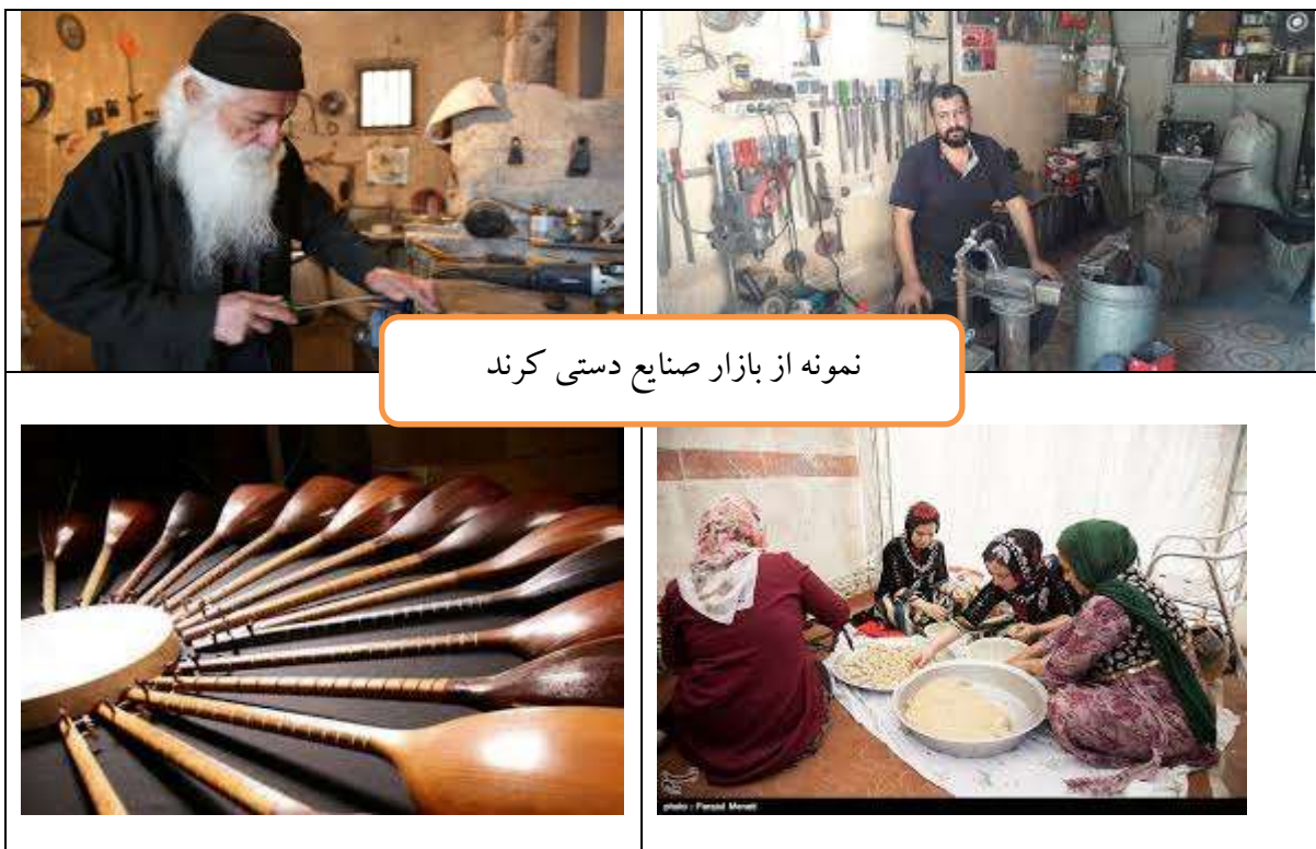
نمونه از بازار صنایع دستی کردند