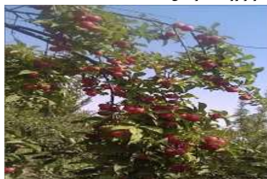
باغ سیب گهواره