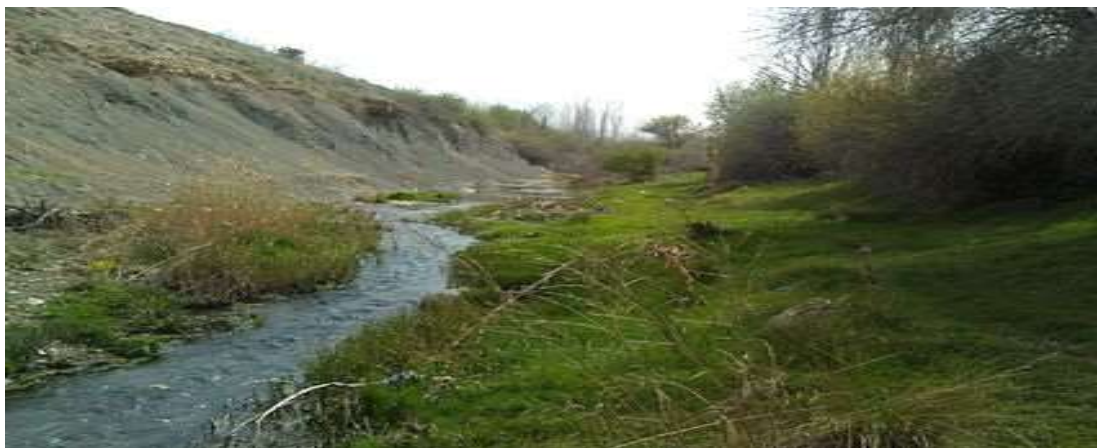
تصویر رودخانه زمکان