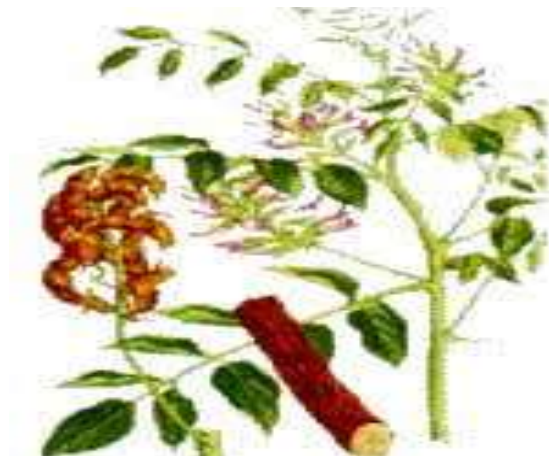
گیاه دارویی شیرین بیان