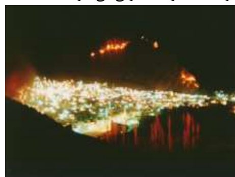
نمایی زیبا از شهر گزند غرب - شب چهارشنبه سوری