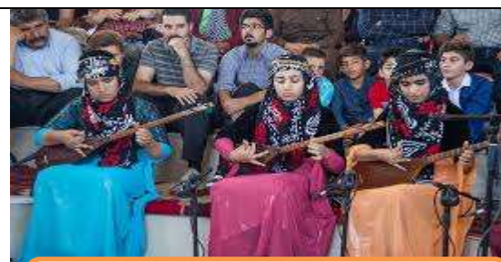
مراسم جشن تنبور در روستای بانزلانی