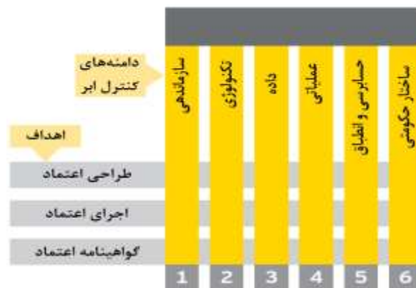
شکل ۲ - اکوسیستم ابر قابل اعتماد [۹]

ساختار و مکانیزم های امنیتی، از ویژگی های کلیدی در رایانش ابری است. این مفاهیم در راستای تحقق رسیدن به یک سرویس امن در رایانش ابری، کمک بلقوه ای خواهند کرد. شش عنصر کلیدی برای مدیران و سازمان های فناوری اطلاعات برای ساخت یک اکوسیستم ابر قابل اعتماد کمک می کند. سازمان ها باید این اکوسیستم رو درک کرده و ویژگی های یک اکوسیستم ابر قابل اعتماد را درک کنند و دستورالعمل های سازمان ها بر پایه این مدل باید ارائه شود. ساختن اعتماد در ابر نیاز به این دارد که به محیط ابری خودتان را ایجاد کنید. شکل ۲ این اکوسیستم را نشان داده است [۳، ۹].