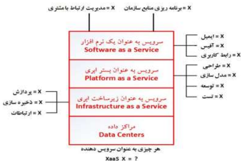
شکل ۱ - سلسله مراتب لایه های محاسبات ابری [۶]

می گیرند. برای قرارگیری در ابر عمومی به یک برنامه کاربردی موقتی نیاز است، زیرا نیاز به خرید تجهیزات اضافی را یک نیاز موقتی برطرف می کند؛ بنابراین، یک برنامه ای که نیازمند کیفیت خدمات است، یا اینکه نیازمند مکان داده از نظر جغرافیایی است، بهتر است که در یک ابر خصوصی یا ترکیبی باشد. جدول ۱ توضیحاتی کلی از لایه های سلسله مراتبی رایانش ابری را نشان داده است [۶].